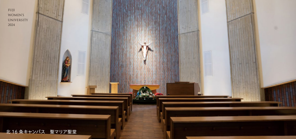
北16条キャンパス 聖マリア聖堂