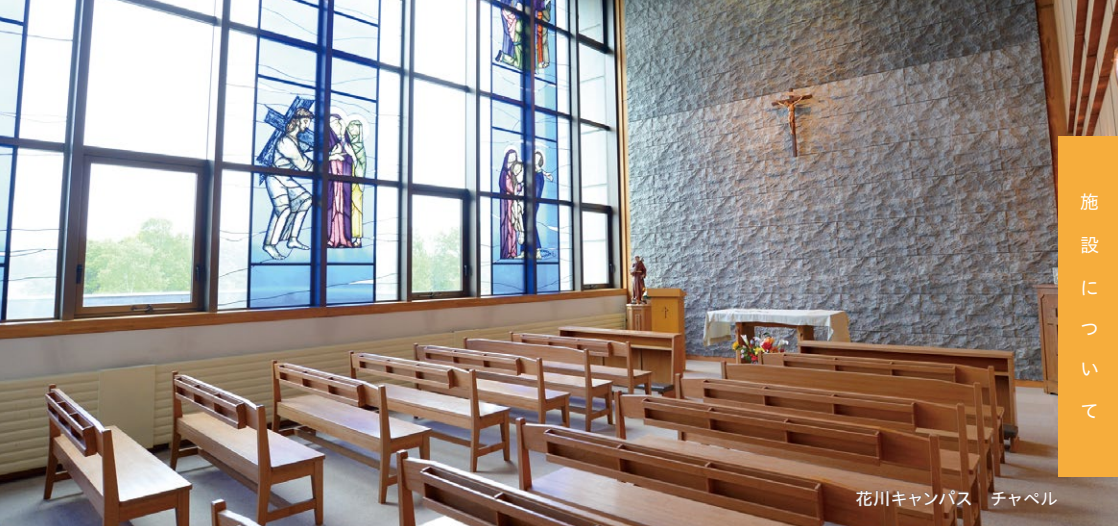
花川キャンパス チャペル